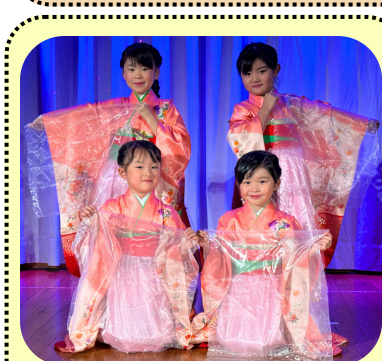
時の流れに身をまかせ