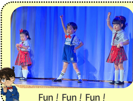
Fun! Fun! Fun!