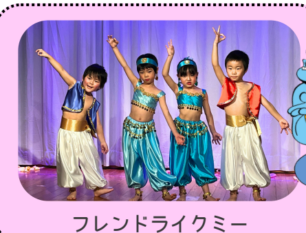
フレンドライクミー