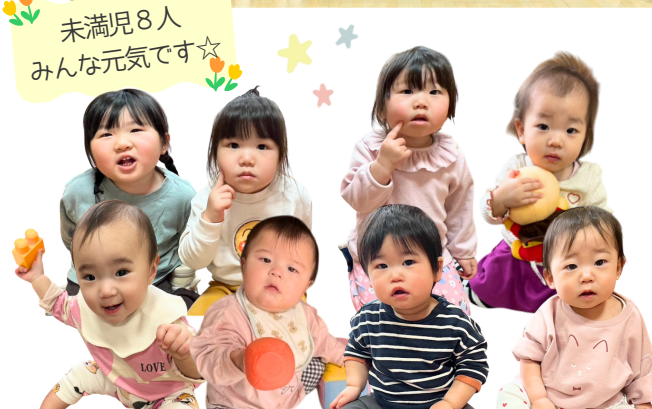
未満児8人 みんな元気です☆

ちょっぴり緊張しながらも、立派な姿を見せてくれた子どもたち(´▽`)♪ これからお友だちや先生と一緒にたくさん の事を経験して「保育園って楽しい!」 と思ってもらえたら嬉しいです! 式に参加していただいた保護者の皆様、 ありがとうございました。